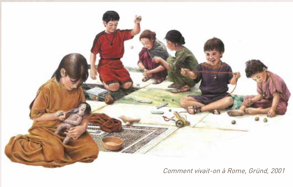
Comment vivait-on à Rome, Gründ, 2001

Possibilité d'accueil : ½ classe primaire ou secondaire – participation des enseignants indispensable.